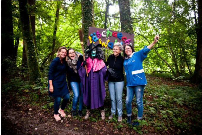
Das KulturOrt Niederwil-Team am Familientag

Stattfinden konnten auch der erste Familientag im Wald sowie der zweite Adventsmarkt im Gewächshaus der Gärtnerei Gisler. Der erste Familientag wurde von Gross und Klein sehr geschätzt. Viele positive Stellungnahmen der Besucher bestärkten uns darin, den Anlass auch inskünftig anzubieten. Trotz Zertifikatspflicht war der zweite Adventsmarkt gut besucht und weihnachtliche Stimmung verbreitete sich im Gewächshaus der Gärtnerei Gisler. Der KulturOrt Niederwil wurde von den Ausstellern für die gute Organisation und für das tolle Engagement gelobt.