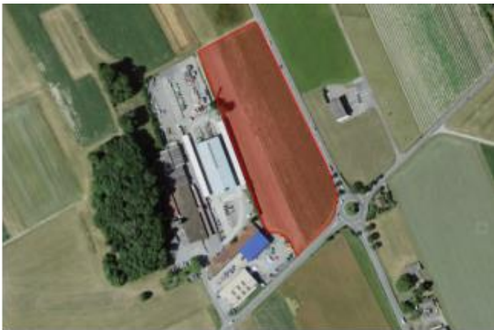
Richtungsentscheid an der Einwohnergemeindeversammlung vom 22. Juni 2021 für das Gewerbegebiet «Geere» (rot markiert)

Das Land wurde zur Bewerbung öffentlich ausgeschrieben. Bis Ende 2020 sind total 31 Bewer-bungen eingegangen. Sämtliche Bewerbungsunterlagen wurden von der Findungskommission und dem Gemeinderat gesichtet. Da die Nachfrage deutlich höher ist als das Flächenangebot und weil bei einigen Firmen festgestellt werden musste, dass ihre Bewerbung die gesetzten Ziel-vorgaben nicht oder weniger gut erfüllen als die anderen Bewerbungen, wurde eine Vorselek-tion durch die Findungskommission und den Gemeinderat vorgenommen.