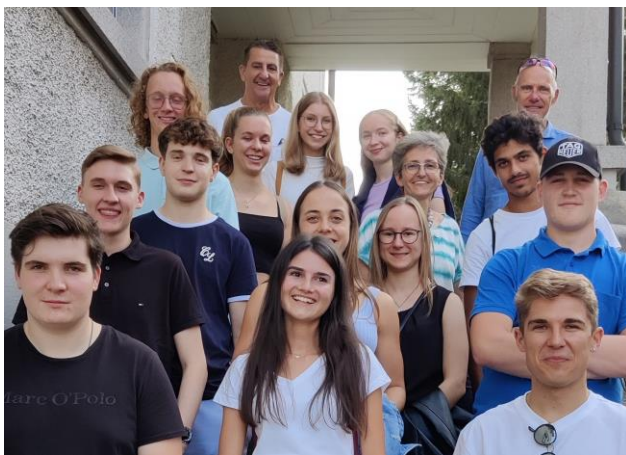
Teilnehmer Jungbürgerfeier 2021 Jahrgänge 2002 und 2003

14 von insgesamt 62 Jugendlichen folgten am 20. August 2021 der Einladung des Gemeinderates zur Jungbürgerfeier. Aufgrund der Absage der Feier im Jahr 2020 wurden ebenfalls die Jungbürger mit Jahrgang 2002 eingeladen.