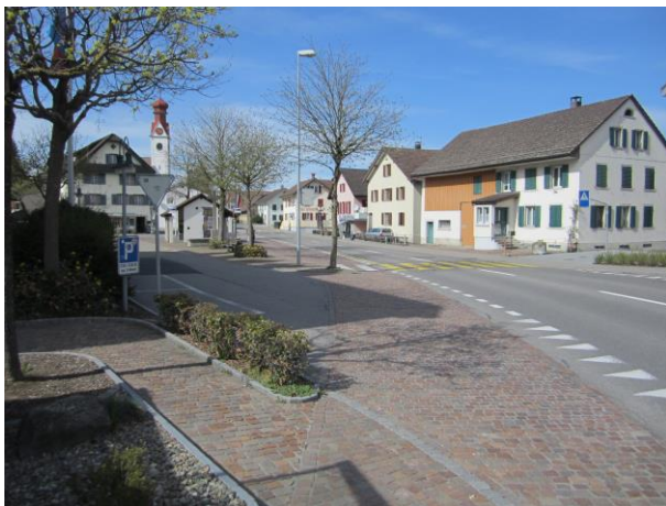
Blick auf den zentralen Planungsbereich: Die Hauptstrasse im Bereich der Bushaltestelle «Zentrum».

2019 führte der Gemeinderat einen Workshop mit der Bevölkerung durch. Die daraus resultierenden Ergebnisse wurden vom Gemeinderat dem kantonalen Baudepartement als Diskussionsgrundlage eingereicht. Nach einer längeren Phase der Grundlagenerarbeitung folgten 2021 die Projektbesprechungen auf Stufe Vorprojekt.