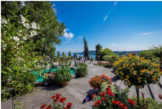
Die Blumeninsel Mainau war 2021 Ziel des Niederwiler Seniorenausflugs

Nachdem letztes Jahr der Ausflug aufgrund der Corona-Einschränkungen nicht durchgeführt werden konnte, folgten dieses Jahr 108 Seniorinnen und Senioren der Einladung des Gemeinderates zum traditionellen Seniorenausflug. Nach dem kurzen problemlosen Zertifikats-Check verteilten sich die Teilnehmenden auf drei Cars und fuhren Richtung Bodensee zur Insel Mainau. Bei schönstem Wetter und angenehmen Temperaturen konnten nach dem feinen Mittagessen die wunderschönen Rosen- und Dahlienbeete bestaunt und fotografiert werden. Heiri Reisen (Elch Tours) und acht Begleitpersonen sorgten dafür, dass alle am Abend sicher und wohlbehalten wieder in Niederwil eintrafen.