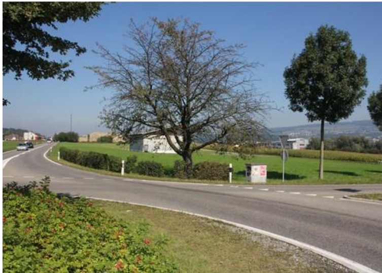
Planungsgebiet Fändler Südost

Der Grosse Rat wies die Einzonungsvorlage am 20. November 2012 an die Gemeinde zur Überarbeitung zurück.