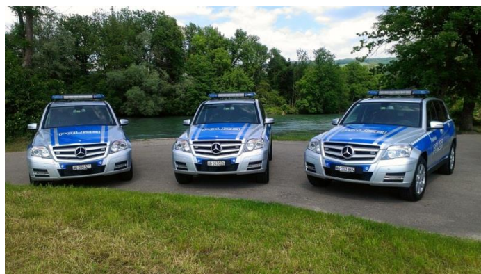
Fahrzeugpark der Regionalpolizei

Mit einer starken uniformierten Polizeipräsenz versucht die Regionalpolizei Bremgarten in ihrem Zuständigkeitsgebiet den knapp 40'000 Einwohnern/Einwohnerinnen ein hohes subjektives Sicherheitsgefühl zu vermitteln. Dies vor allem in den Rand- und Abendstunden sowie an den Wochenenden. Damit die Regionalpolizei all dies und die vom Kanton geforderten Standards eines 24-Stunden Betriebes aufrechterhalten kann, stehen ihr zurzeit 1 Polizistin und 13 uniformierte Polizisten (inkl. Pol.-Chef) zur Verfügung. Im administrativen Bereich werden sie soweit als möglich tatkräftig von 2 zivilen Mitarbeiterinnen (120 Stellenprozenten) unterstützt. Zudem ist ein weiterer Ausbau der Regionalpolizei bis ins Jahr 2017 vorgesehen. Dies im Rahmen des Projekts "Horizont" und gemäss Polizeigesetz, welche bis 2017 im Kanton Aargau eine Polizeidichte von 1:700 (inkl. Kantonspolizei) vorsehen.