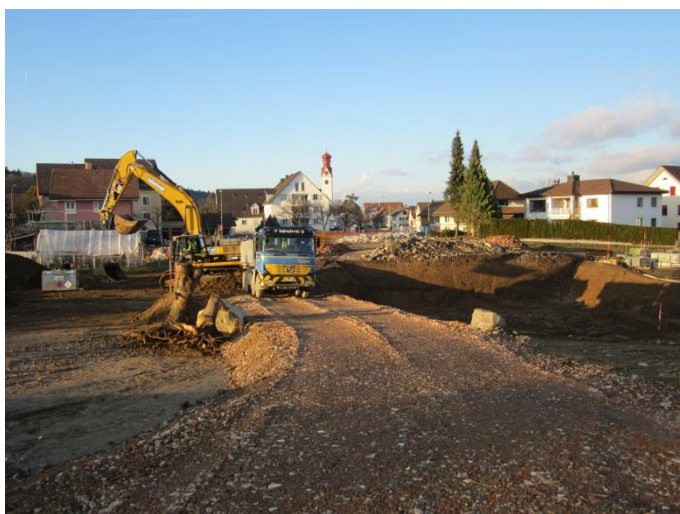
Überbauung Vorderdorf vor einem Jahr