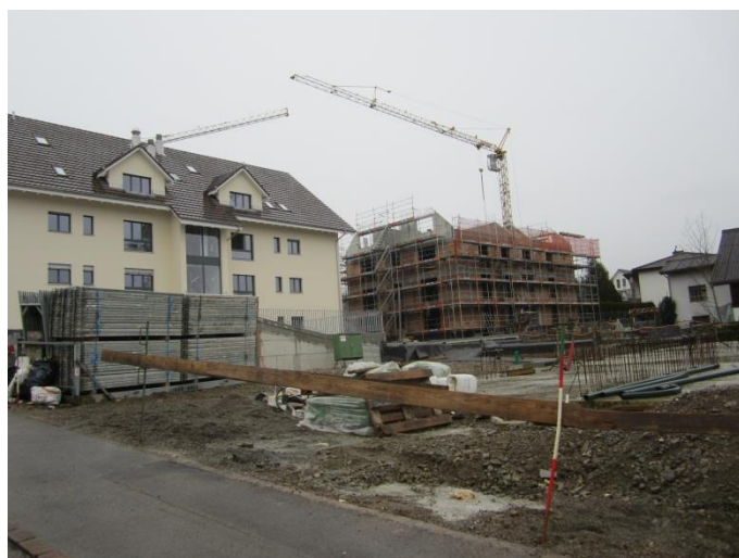
Überbauung Vorderdorf heute