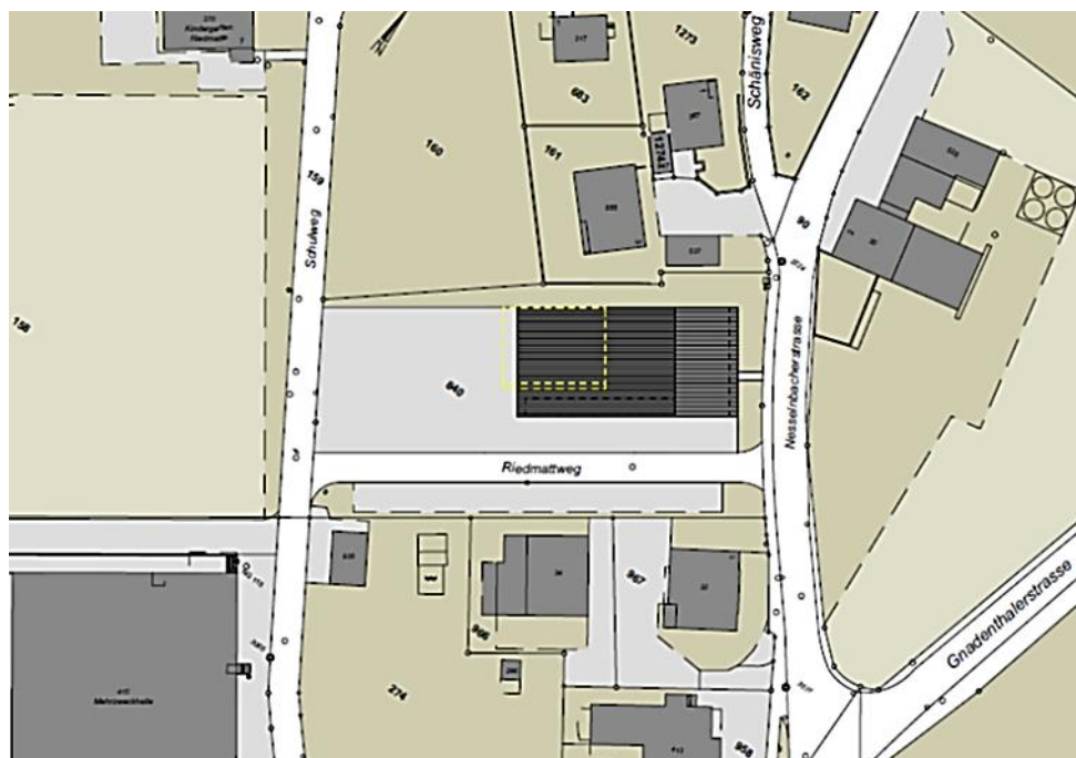
Neues Feuerwehrlokal am alten Standort

Nachdem bereits im Jahre 2011 der Entscheid „Pro Variante Eigenständigkeit der Feuerwehr“ von den beiden Gemeinderäten Niederwil und Fischbach-Göslikon gefällt wurde, konnten im Berichtsjahr vertiefte Abklärungen betreffend Feuerwehrlokal, Fahrzeuge und Organisation getätigt werden. Am 13. Dezember 2012 präsentierten die Gemeinderäte der interessierten Bevölkerung die Resultate. Die Geschäfte gelangen 2013 zur Abstimmung.